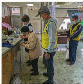
金融機関への動向支援

サポートを受ける「お願い会員」さんからは、こんな声が届いています。「助かるのはもちろんだけど、誰かが自分のことを気にかけてくれる。それが何より嬉しいんだ。」