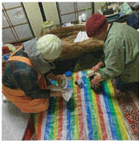
年末の大掃除のお手伝い

西伊豆町の山間部、人口171人（R8.4.1現在）の大沢里地区。ここでは今、少し特別な「日常」が動き出しています。