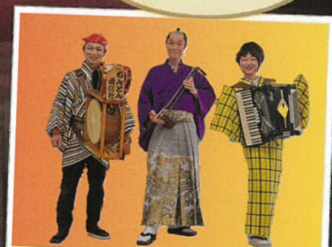
二胡さむらいwithちんどん通信社