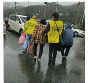
月に1度のお買い物ツアー

最近、嬉しい変化がありました。以前は「認知症の方にどう接すればいいか不安」と漏らしていたお助け会員さんが、今ではごく自然に、相手の心に寄り添った会話を楽しんでいるのです。