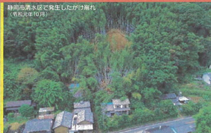
静岡市清水区で発生したかけ崩れ (令和元年10月)