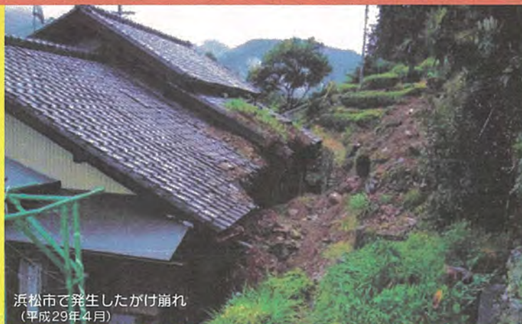
浜松市で発生したかけ崩れ (平成29年4月)