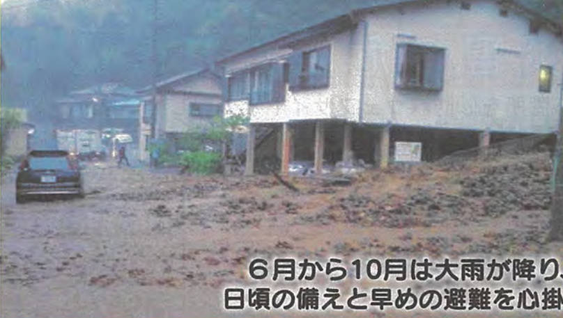
下田市で発生した土石流 (平成29年4月)