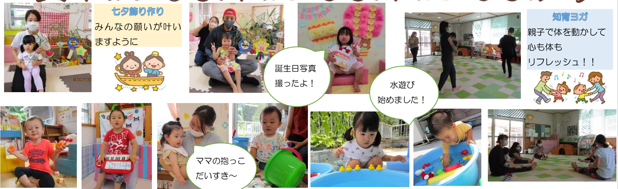
七夕飾り作り みんなの願いが叶いますように

←子育て支援センター「たんぽぽ」LINE公式アカウントです。登録すると、たんぽぽ通信がカラーで見られたり、イベント募集や警報発令によるセンター閉所のお知らせなどが届きます。