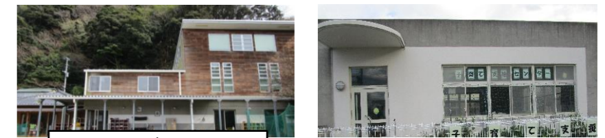
階段を上がって2階