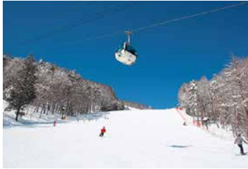
▲パノラマリゾート (シーダーゲレンデ)

西伊豆町の皆さま、あけましておめでとうございます。今年も富士見町だよりをよろしく申し上げます。富士見町では、12月より2つのスキー場がオープンしました。近年は暖冬の影響か、雪が思うように降ってこない年も少なくないのですが、新たな降雪機の導入などにより最高の仕上がりとなっています。