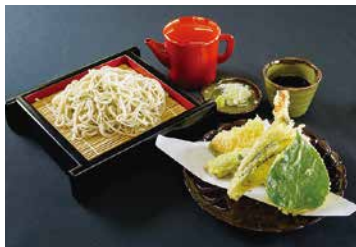
▲高原スキー場 (そば処 花鳥屋)

晴天率の高い富士見町は、青空のもとでスキーやスノーボードができる機会も多く、特に晴れた日のリフトやゴンドラから望む景色は、寒さを忘れて見入ってしまうほどの絶景です。ぜひ、ご自分の目で確かめてみてください。