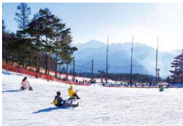
▲高原スキー場 (キッズスノーランド)