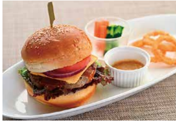
▲パノラマリゾート (山麓レストラン「オリオン」)