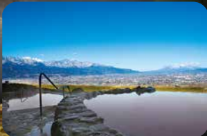
▲昼の景色も絶景です

みはらしの丘・みたまの湯は、甲府盆地が一望できる標高370mの丘陵高台に位置しています。露天風呂からの南アルプス・八ヶ岳連峰の眺望は絶景で、夜景100選にも選ばれました。心が和む、至福のひとつときをお過ごしください。