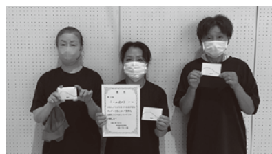
3位 チーム203 主催：西伊豆町体育協会