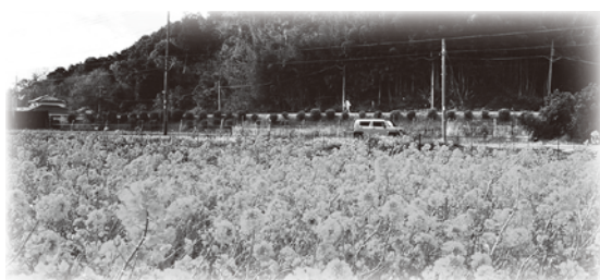
▲菜の花 開花の様子(2023年1月下旬撮影)