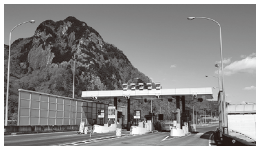
▲修善寺道路料金所