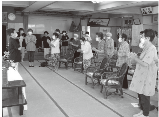
7月の大浜地区講座の様子