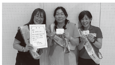
1位 食べごろです。うふ♡