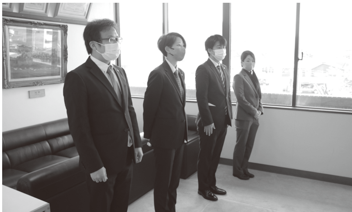
▲令和5年度新規採用職員辞令交付式