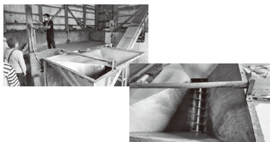
生ゴミをコンテナに投し、粉碎機で粉碎