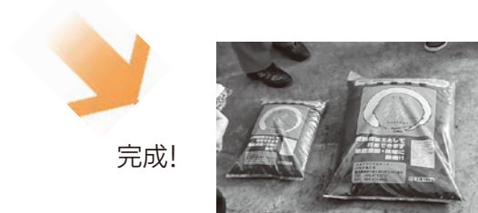
完成! ゴミが堆肥へと生まれ変わった!