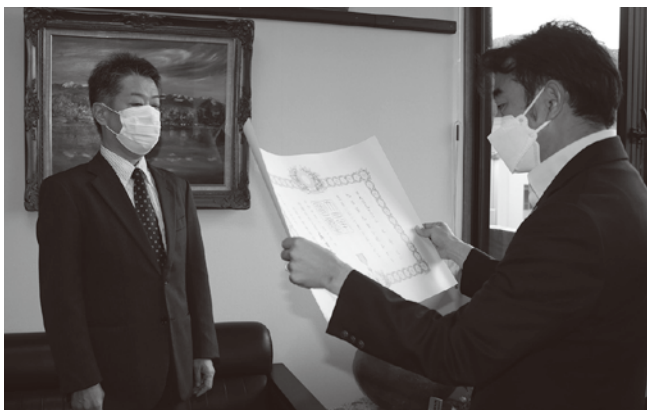
▲叙勲の伝達を町長から受ける次男の禎寿氏