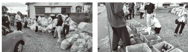
分別に積極的に参加する大崎町民の様子

視察では、早朝の分別回収に参加し、実際に住民の方から意見を伺いました。また、リサイクル施設や最終処分場を見学し、大崎町のリサイクルシステムについて理解を深めました。その後、地域の衛生自治会と意見交換をしました。導入前と比べ、いかに高いリサイクル率の町へと発展したのか、現在の取り組み等を含めて学んできました。