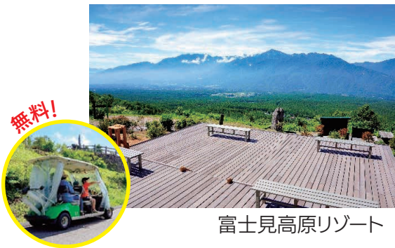
富士見高原リゾート

富士見町の魅力を静岡県の皆さまに体感していただくため、静岡県民の方 先着2万名様 に2大リゾート(富士見パノラマリゾート、富士見高原リゾート)の無料キャンペーンを実施しています。