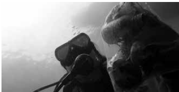
↑ 海底から引き揚げられたゴミの一部