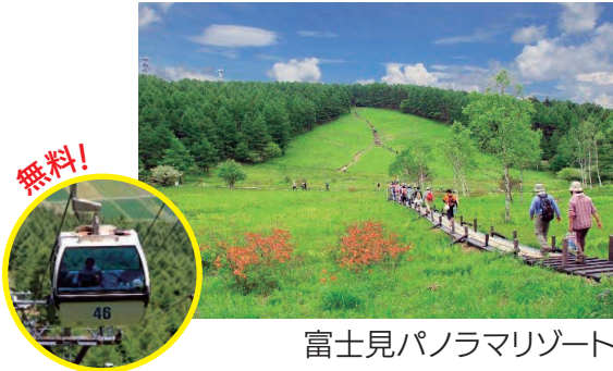
富士見パノラマリゾート