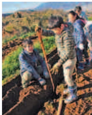
▲にんじん収穫体験の様子