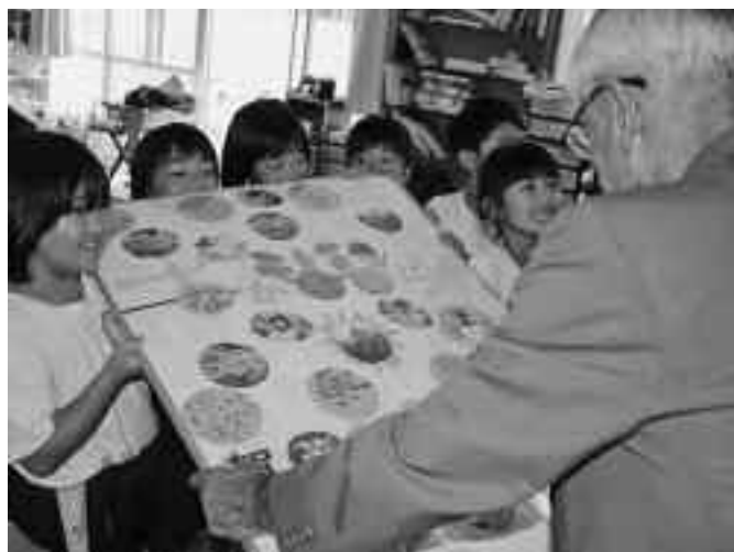
▲育てたひまわりの種は、来年別の学校に配られます