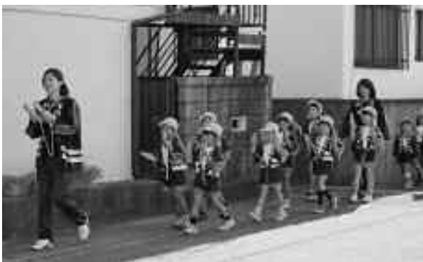
▲空気が乾燥し、火災の発生しやすい季節になっています。火の取り扱いに注意してください。