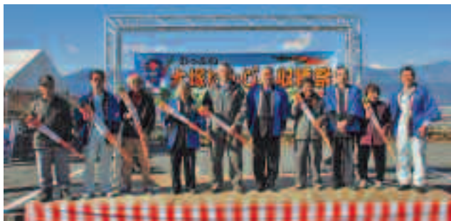
▲にんじん品評会で受賞された皆さん