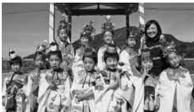
▲烏帽子や冠を被り、菓子まきや踊りの披露も行いました