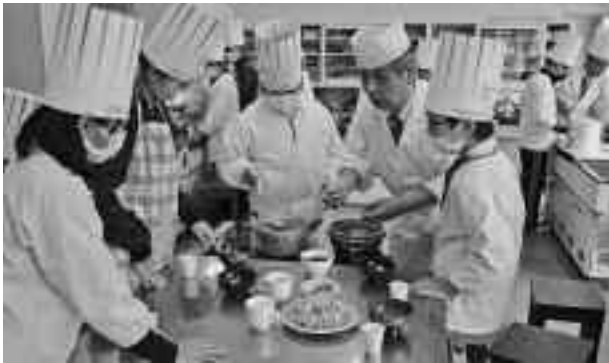
▲本物の技を五感で感じました