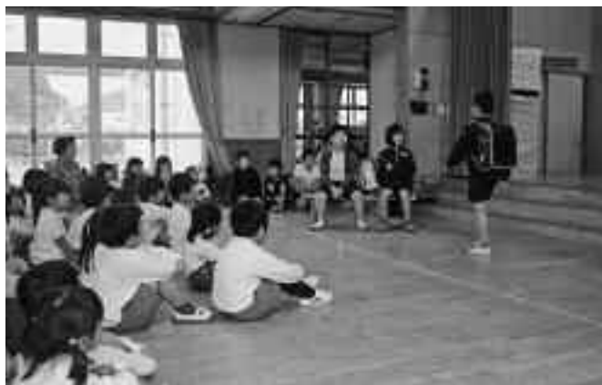
▲様々な場面ごとに寸劇にして、わかりやすく「あいさつ」の大切さを説明