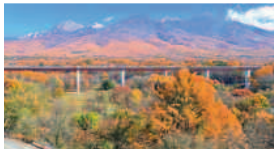
▲第4回 八ヶ岳部門 最優秀賞「秋の八ヶ岳」

賞など、たくさんの賞をご用意しています。入選作品は2月25日に開催する「富士見の日」で表彰し、町のホームページや観光パンフレット等に掲載の他、町内の様々な施設で巡回展示されます。