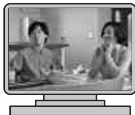
「暮らしを支える税を学ぼう」