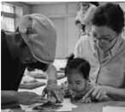
▲小さな手や足をペタン