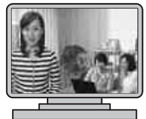
「国税庁ホームページの上手な使い方」

詳しくは国税庁ホームページトップページ下段 http://www.nta.go.jp/webtaxtv/index.html