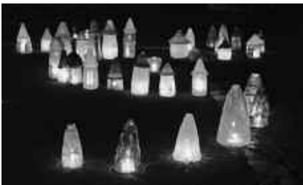
▲全てがアート作品によるキャンドル・ナイトは全国的にも珍しいものとなっています