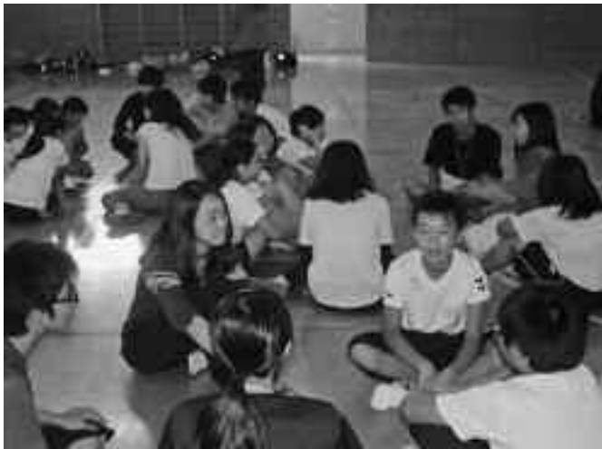
▲あなたは、実際に西伊豆町で大地震が起こったらどうしますか？