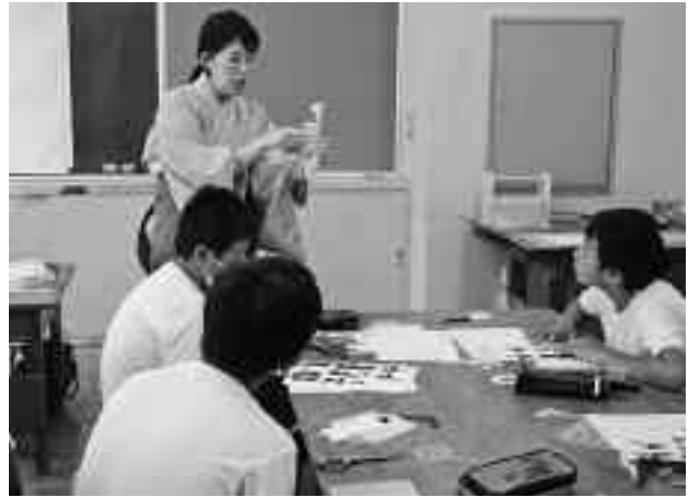
▲下書きなしで、話しながら完成する作品に驚き

下書きなしで話しながら完成した「秋祭りのみこし」などを披露してもらったあと、実際に生徒たちが頭の中に作品のイメージを浮かべて、熊やウサギ、天使などのテーマに挑戦しました。「みんな上手にできている。今後、コミュニケーションの一つとして紙切り絵を披露してほしい」とアドバイスをもらいました。