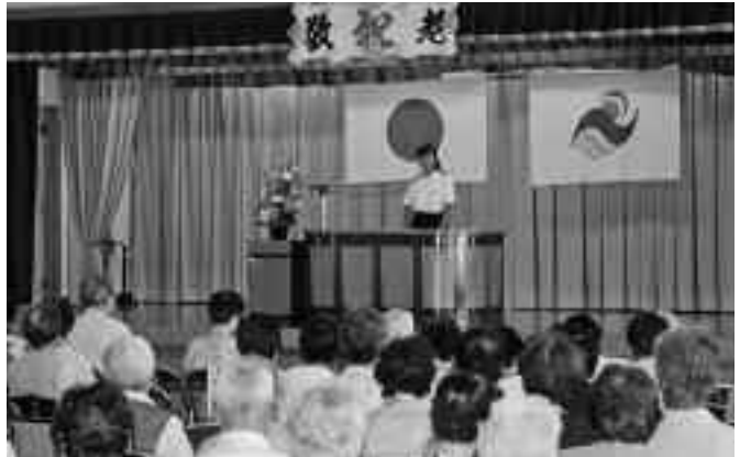
▲おじいちゃん・おばあちゃんに向けてのメッセージ