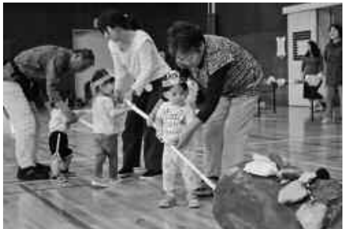
▲父・母のみならず、祖父・祖母も参加して盛り上がりました。

「うんとこしょ、どっこいしょ」では家族の方々と協力して、カブやイモ見立てた作品にロープをつけて一生懸命に引っ張りました。