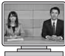
「社会保障・税番号制度」