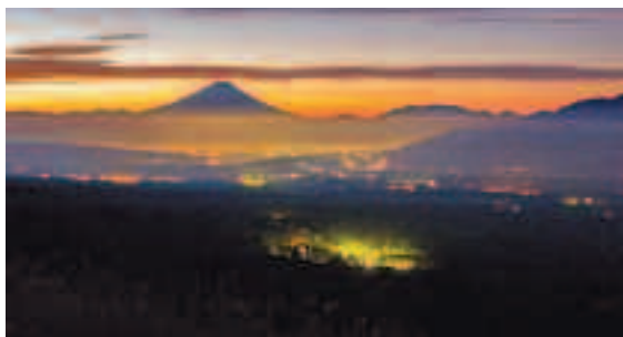
▲第4回 富士山部門 最優秀賞「夜の灯火」

今年で5回目を迎えた富士見の日フォトコンテスト。今回のテーマは「私のとっておきの富士見町」です。町内から撮影した作品であれば、季節、撮影期間、撮影対象の指定はありません。富士山や八ヶ岳など山のある風景はもちろん、人々の暮らしや田園風景、ひそかにいいなと思っていた身近な景色、富士見で見つけたあんなこと、こんなこと。お子さんや初めてカメラを持った方、どなたでもご応募いただけます。