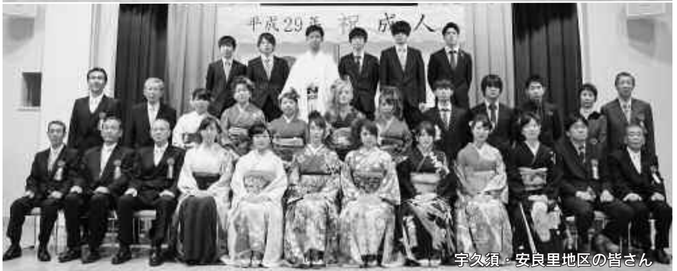
宇久須・安良里地区の皆さん