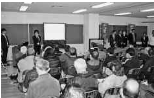
真剣に話を聞いていました

光ブロードバンドの利用方法や改善点などが説明されたほか、個別の利用料金や工事などについて、相談を受けました。町では、昨年7月ICT利活用に関する協定書を締結し、情報配信等の検討をしています。