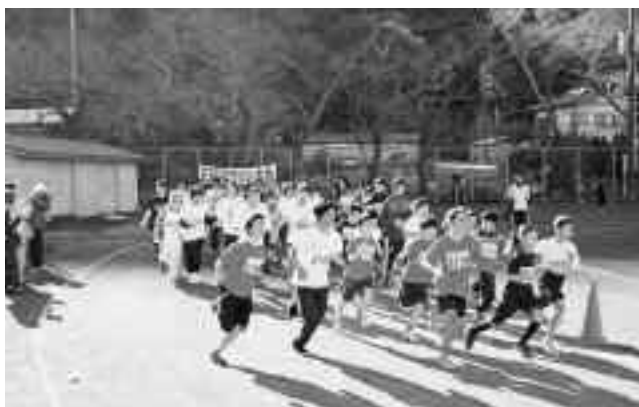
一斉にスタートするランナー