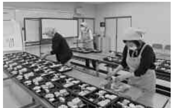
ていねいに盛り付けていました。

一足早く正月気分を味わってもらおうと、毎年末におせち弁当を調理し、独居高齢者などに届けています。今回は、安良里にちなんでサンマのすり身を使った昆布巻きやエビかまぼこなど、彩りや栄養を考えた11品を作り、折り紙のコマや手紙を添えて、配達しました。