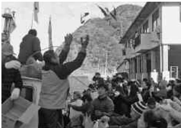
安良里漁港では、サンマが空を舞いました

また安良里漁港では、豊幸丸が昨年水揚げし冷凍しておいたサンマ約1,500匹のほか、もちやみかんが船上からまかれ、帰省した住民などたくさんの人が集まりました。新春の港はサンマを手に入れ喜ぶ子どもの姿などでにぎわいました。