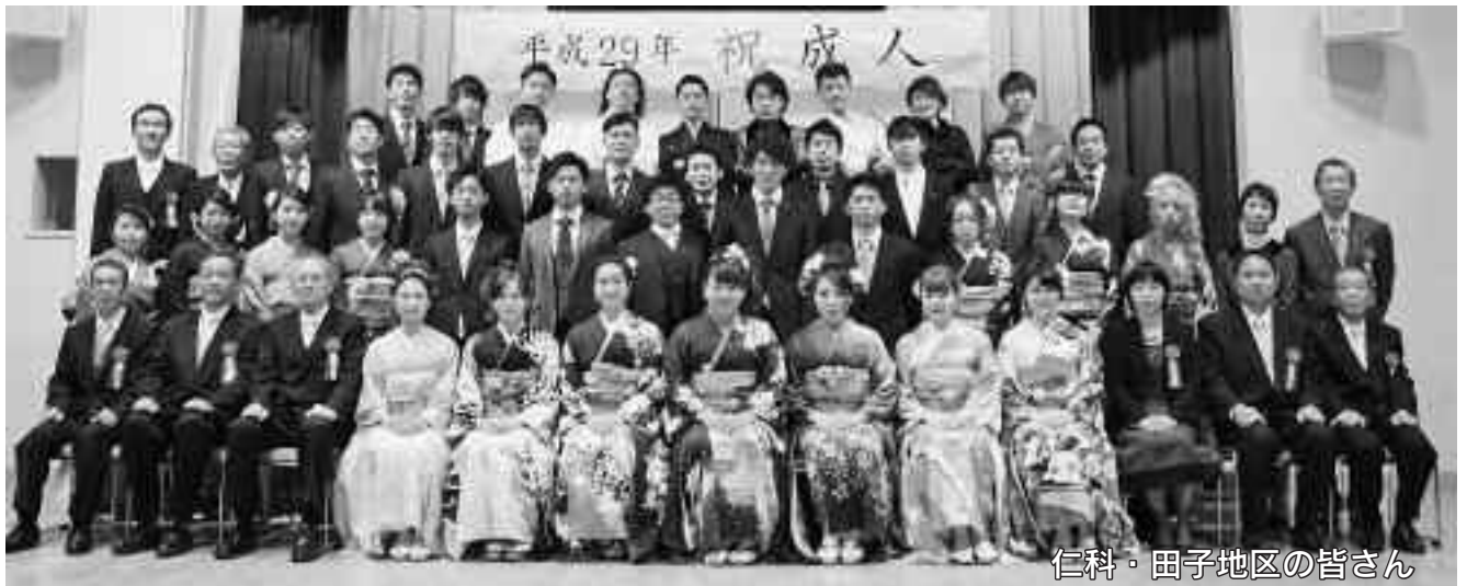
仁科・田子地区の皆さん