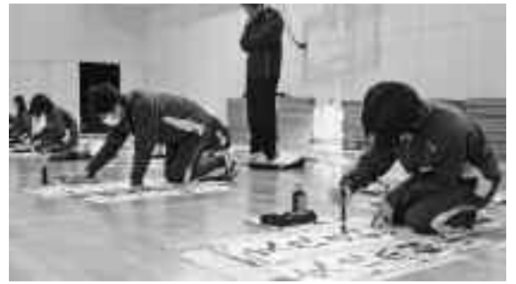
みんな真剣な表情で書き上げました

手本を見ながら、それぞれの課題の「止め」や「はらい」に注意しながら、一筆一筆真剣な表情で、書き上げていました。書き上げた作品は、校内に展示後、各学年から数名ずつが賀茂地区の書き初め展に出品されます。