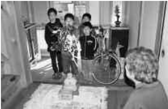
1班40軒ほど回ります。