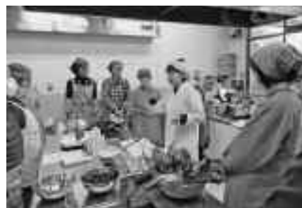
元気アップセミナーではいきいきとした心と体をつくる食事について学んでいます。