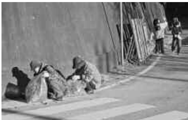
落ち葉もたくさんありました

自分たちの暮らす地区をきれいにしようと、多くの地域の方々が参加しました。ゴミは落ち葉など軽トラック4台分集まり、車のマフラーや釣竿など粗大ごみも数多く回収されました。安良里まちづくり委員会では、毎年12月頃に奉仕活動を行っています。