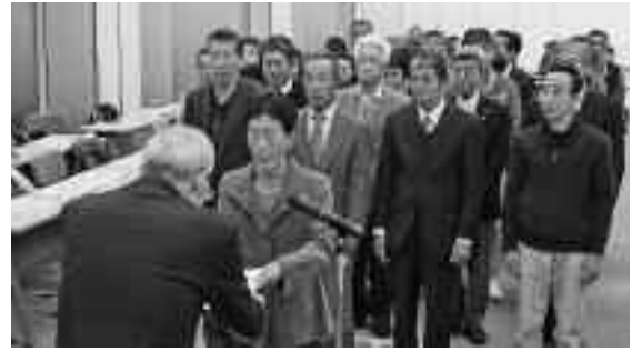
よろしくお願いします

委員の任期は3年で、新たに12名が厚生労働大臣から委嘱を受け、町長から一人一人に委嘱状が交付されました。また、14名が任期を迎え退任しました。各地区の民生・児童委員は広報にしいず2月号でお知らせします。