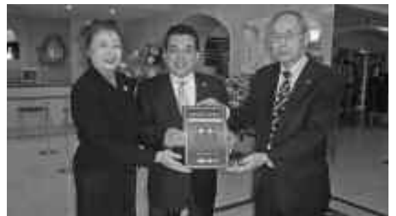
今後とも協力よろしくお願いします。

協力事業所は、消防団員である従業者を雇用し、消防団活動について積極的に配慮しているなど貢献を評価するもので、事業所に対し協力事業所表示証を交付しています。表示証は建物などに掲示し、広く公表することができます。