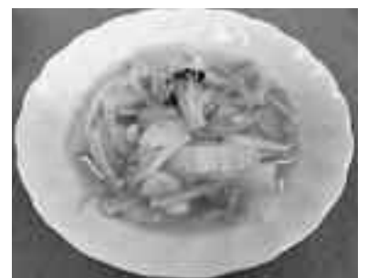
賀茂地域の地産地消レシピより