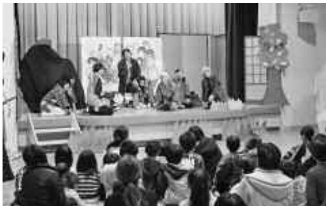
迫真の演技で、みんな見入っていました