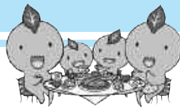
生きがいと健康づくりのイメージ ©静岡県 キャラクター「ちゃっぴー」