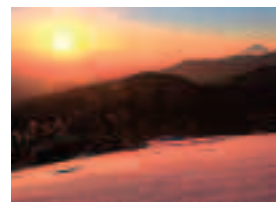
「荘厳な夜明け」 太田秀男