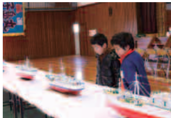
精巧につくられた漁船模型に興味津々

3月21日～23日、「日本一の夕陽と田子の文化を楽しむ会」を行いました。旧田子中学校体育館で、手作りの漁船模型を展示。本物のカツオ船やマグロ船を基に精巧に製作されており、見学者はかつて田子港に浮かんでいた漁船群を懐かしんでいました。