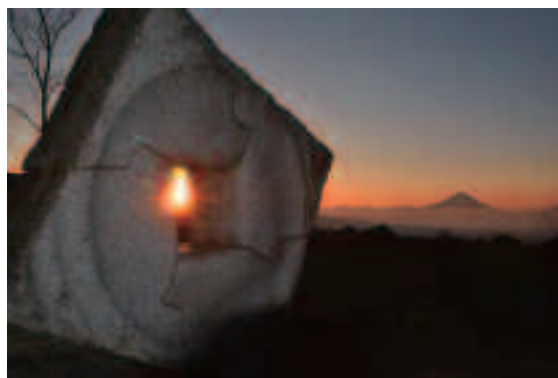
「朝日昇る彫刻と富士山」植松洋一

富士山が世界遺産登録されたことを記念し「第1回富士山フォトコンテスト」が開催されました。審査員による厳正な審査の結果、入賞作品が決まりましたのでご紹介します。大変多くの作品をご応募いただき、誠にありがとうございました。