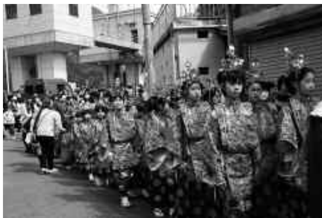
幼児から小学6年生まで大勢が参加した稚児行列

安良里地区在住の子どもだけでなく、地区外に住んでいる安良里出身の子どもなど約130名が参加しました。沿道では、地域住民や家族などたくさんの方が見守りました。参加者の中には、30年前に稚児として参加した保護者もいました。