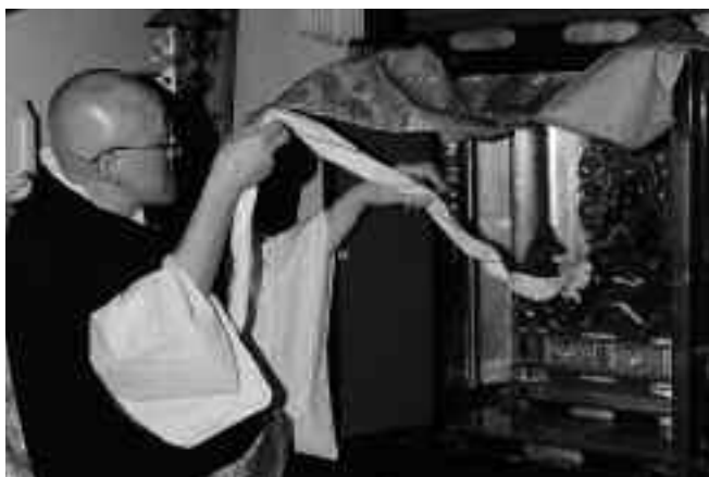
「縁の綱」が結ばれた不動明王像

3月27日から29日にかけて、安良里地区の大聖寺で30年ぶりに本尊が開帳され、地域住民などに公開されました。本尊の扉が開かれる27日午前0時には、深夜にもかかわらず、約50人が参列し、住職のお経が終わると、普段見ることができない不動明王像に神秘的な面持ちで手を合わせていました。