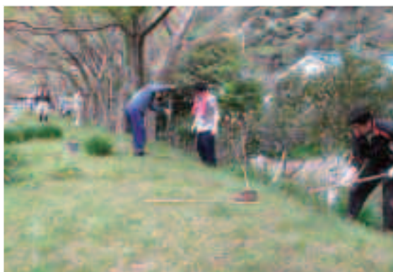
ていねいに作業しました

4月13日、みつまたの植栽を行いました。昨年を引き続いて2回目で、一色町内会有志25名の協力を得て、仁科川沿いの堤防や枕状溶岩付近などに100本のみつまたを植えました。今回植えたみつまたの苗は、高さ1mほどで、うす黄色の花が付いており、すでに通行する人の目を楽しませています。