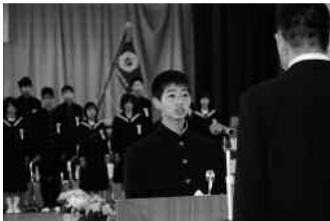
新入生を代表して誓いの言葉

男子9名が入学した田子小学校では、町長から一人一人に教科書が手渡されると、緊張した様子