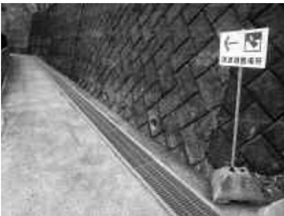
沢田区が設置した看板