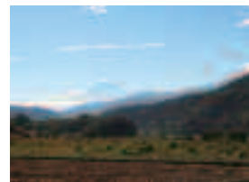
「富士見町下葛木から見た富士」 坂本鉄二郎