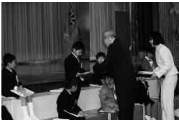
一人一人教科書を受け取りました

4月7日から8日にかけて、町内の幼稚園・保育園、小中学校で入園式、入学式が行われました。