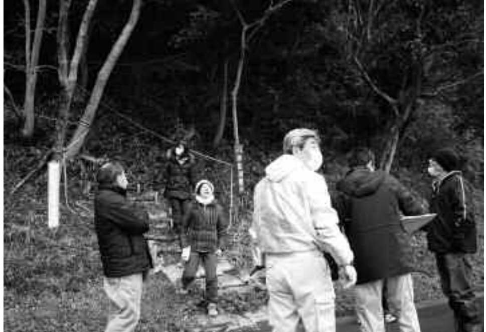
避難路を視察する委員

ている避難路や避難地、またこれから整備を予定している場所など36カ所を視察、今後の検討事項や参考点などを確認しました。