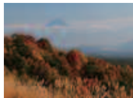
「雲上の富士」 小池博之