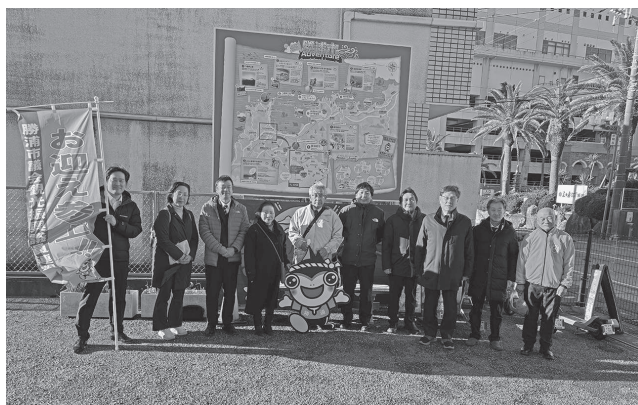
勝浦市観光協会と市議会の皆さんと

1月21日～22日に南房総市と勝浦市視察に行きました。南房総市では花き、獣害対策、道の駅などの説明を受け、8カ所の道の駅が地元の活性化に役立っていました。勝浦市では朝市と歴史、漁港直送の流通の仕組みなどの視察をしました。