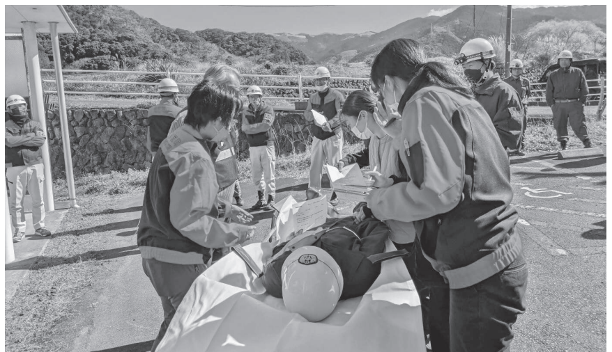
宇久須地区の救護所設置訓練の様子