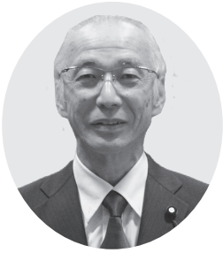
やまもと 山本 豊 議員