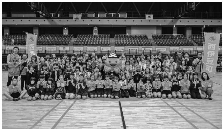
西伊豆町PR冠試合(ベルテックス)

答 加入者が増える見込みは少ないですが、移住担当と連携し、温泉が引けることを付加価値として物件を紹介していきます。