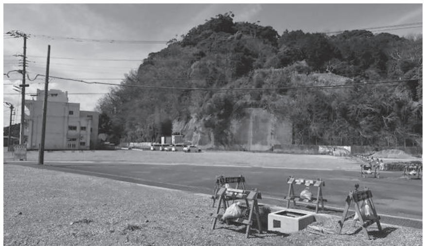
概算費用調査が行われている旧西伊豆中学校跡地

町長 財政計画は必要ですが、大規模事業の計画が不透明のため、概算費用も見込めない状況です。現時点では財政計画は策定できていません。