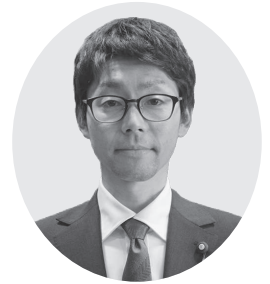
つみ けい すけ 堤 圭 祐 議員