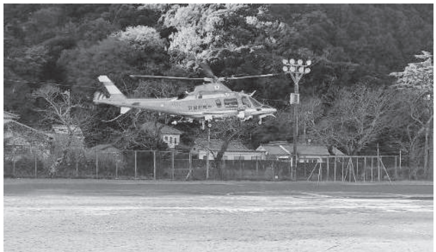
防災訓練に参加の静岡県警察ヘリコプター (賀茂小)

町長 移動車両投票所は、二重投票や別人投票のリスクが高まるなど、移動投票所の設置は難しいです。