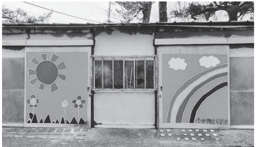
仁科小学校 卒業制作

町長 定例会や面談で要望を確認し、普段から相談できる体制づくりが必要と考えています。現役隊員がOB・OGと交流できる仕組みを検討していきたいです。