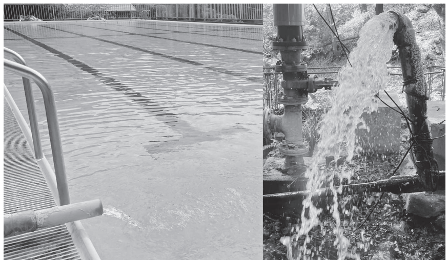
やまびこ荘の温泉プールと未利用の温泉

町長 返礼品の開発やテスト販売に特化する支援制度はありませんので、商工会や国の支援制度を活用することがよろしいと考えます。