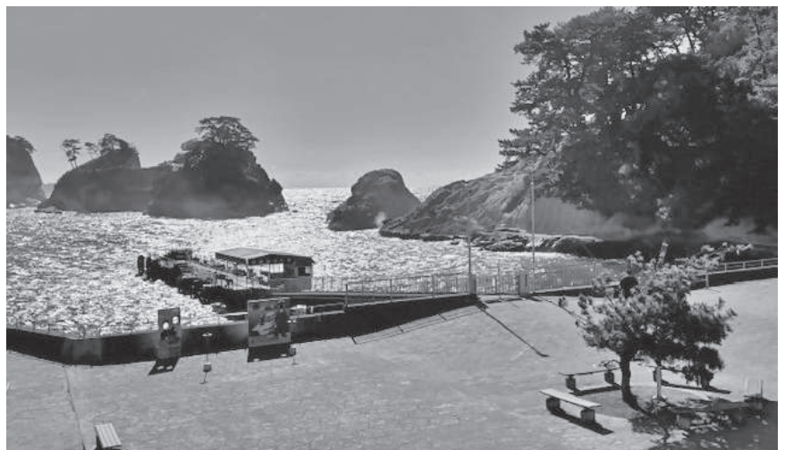
観光地、堂ヶ島のこれからは

町長 現状としては民間の建物で指定している避難施設はございませんが、区と建物の所有者で話し合いを行い、有事の際は避難場所として使用できるようになっている施設もございます。