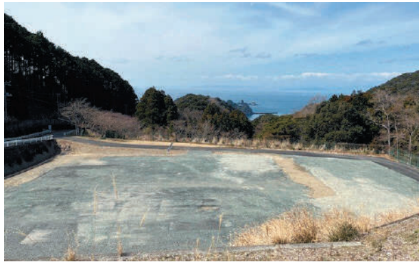
新斎場建設予定地の現況