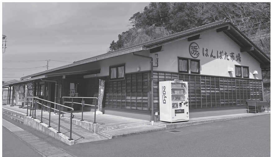
新鮮な海産物や地元農産物を販売する はんばた市場

総務課長 3月にカスタマーハラスメント研修を予定しており、パワハラなどの研修も機を捉えて検討を継続します。