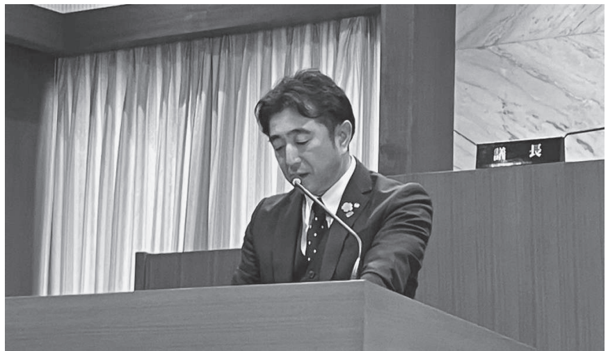
施政方針を述べる町長

既存の西豆衛生プラント組合に斎場事業が組み込まれ、「西豆広域行政組合」として動き出しました。事業については8年3月に建設にかかる入札を執行し、組合議会において、契約に関する議案が上程される予定です。この議案が可決されますと、正式に工事着工となり、9年4月稼働に向け動き出します。現在、使用している斎場に関して