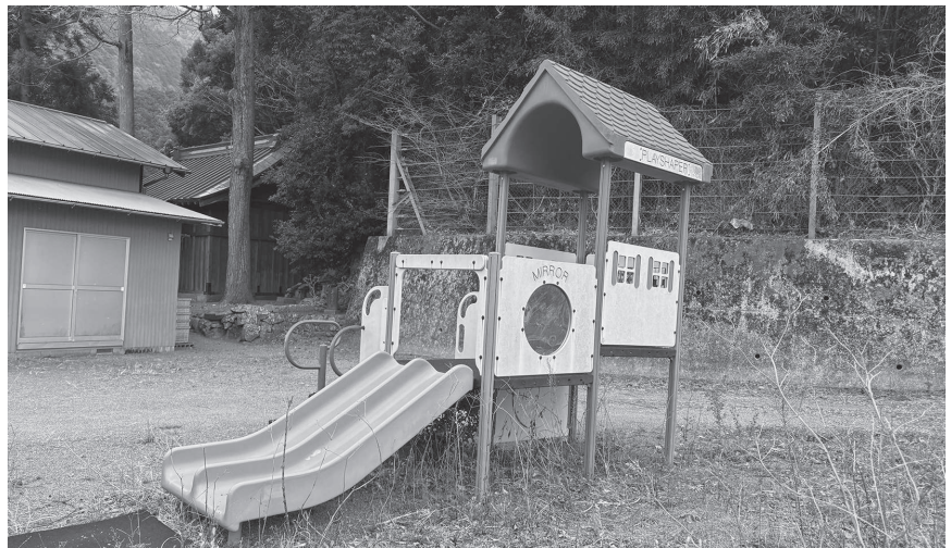
宇久須浜 牛越神社境内の遊具