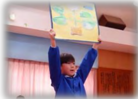
5歳児「世界にひとつだけの詩」