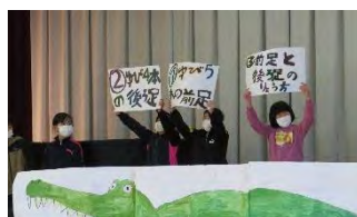
ふれあい集会(2年生)

8日のふれあい集会は2年生の発表でした。2学期にバナナワニ園へ行った時のことをクイズにしながら、詳しく伝えてくれました。マスク越しでしたが大きな声ではっきり話すことで聞き手によく伝わりました。