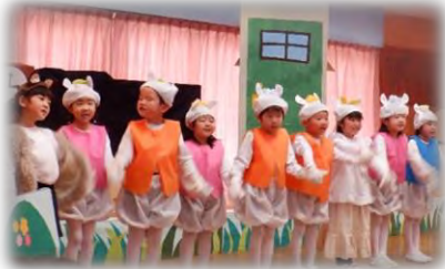
4歳児 劇「おおかみと7ひきのこやぎ」