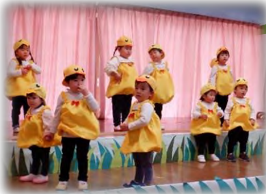
1歳児・2歳児 リズム「ピヨピヨ行進曲」