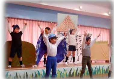
5歳児 劇「よろしくもだち」