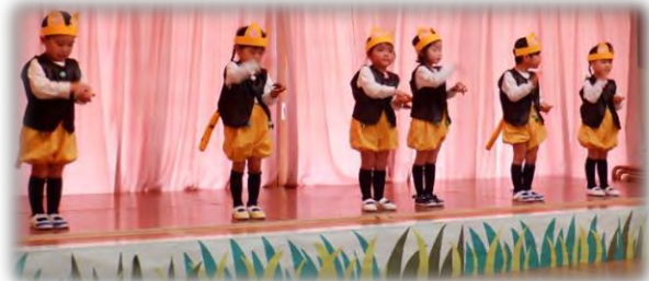
3歳児 カステネット「ねこふんじゃった」