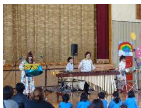
はんかつしゅコンサート

21日、家庭教育学級との共催でスチールパンを中心とした打楽器のコンサートが開かれました。初めて見る楽器の音色に魅了され心地よい楽しい時間を過ごすことができました。仁科認定こども園の年中、年長児も参加し、リズムに合わせて踊る場面もありました。