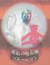
魔物の魔術師 ワスレバ