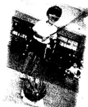
スイカ割りたのしかった!!