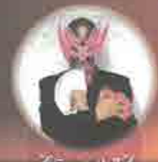
ブラックラビット