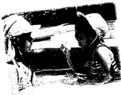
お友達と大好きなプール遊び☆ 気持ちよかったですね

5歳児がオリジナルの映画を作り、みんなに上映してくれました。題「おしたちのぼうけん」