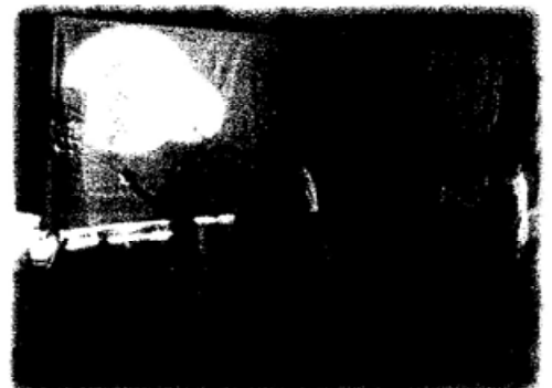
透明のプラスチック板にマジックで絵を描き、懐中電灯で照らしスクリーンに映し出しながら物語を進めていく。