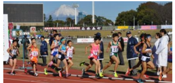
写真：前回の小学生1500mレース

日 程：12月3日（土）大会当日 午前5時30分 役場本庁前 出発 午後7時頃 西伊豆町 到着予定 乗車料金：無料（ご希望のバス停で乗降できます） 募集人数：40名（先着順） 募集期間：11月14日（月）～25日（金）