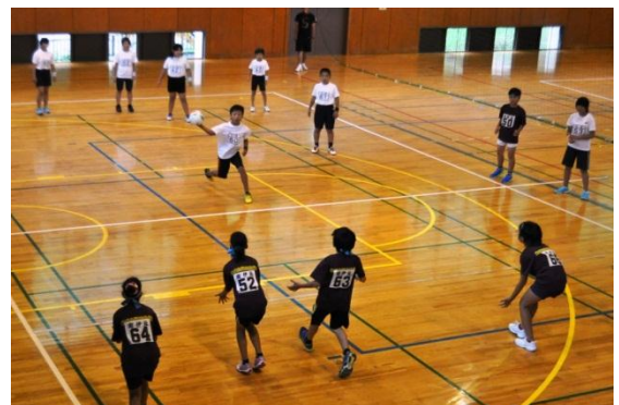
写真 上：平成26年度西伊豆町子ども会球技大会 下：平成26年度賀茂郡子ども会球技大会