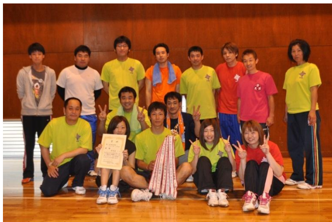
優勝：安良里チーム

5月17日（日）に、健康増進センターおよび西伊豆中学校体育館を会場として、「第11回地区対抗バレーボール大会」を開催しました。