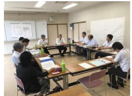
新校舎の施設整備を協議する委員

主な審議項目: 校名、校歌・校章、制服制定に関する内容・方法等(かばんも含む)、新中学校の目標・グランドデザイン、静浦小中一貫校視察、新校舎設計における要望事項を業者と協議等々。