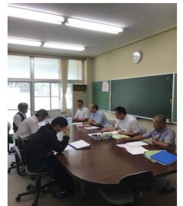
グランドデザインを協議する運営部員

主な審議項目: 学校運営部会(学校教育目標、日課表、教育課程、PTA、学校予算など)、学習・生活部会(学習内容、定期試験、学校生活の決まり、生徒会、部活、給食など)