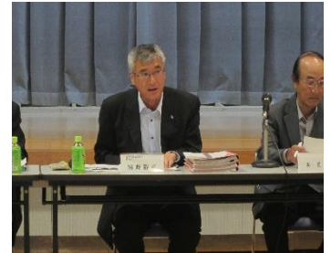
質問に答える清野教育長

主な決定項目: 一貫校に関して「施設一体型一貫校」、「学年割は4. 3. 2年生」。新中学に関して、校名「西伊豆中学校」、校歌・校章「制定せず」、制服「一貫校7年生より制定」、「選定方法は保護者の意向によるものとする」、「かばんは小学生ランドセル・中学生は背負うタイプ」、新中学校の目標・グランドデザインの承認等々。