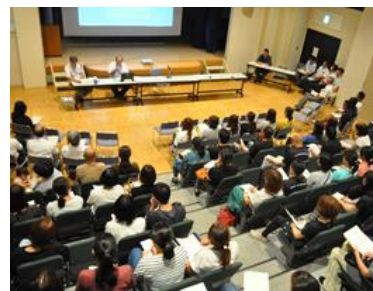
説明を受ける保護者の皆さん

どの委員会の会議においても、積極的かつ建設的な意見をたくさんいただきました。事務局では、改めて各委員・部員の皆さんの統合に関する意識の高さと、その職責の重さを認識したしだいです。今後もまだ様々なことを協議し決めていかなければなりません。そのためにも今年度の委員さんはもとより、令和2年度人事異動等によって入れ替わった新役員さんも含め、引き続き活発な話し合いを進めていけたらと思います。