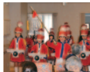
▲鼓笛隊によるにぎやかな演奏