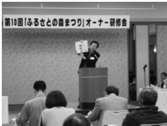
▲森林・林業の現状についての講話

4月14日、15日の両日、宇久須財産区に育成途上の杉を所有している「ふるさとの森オーナー」の皆さんが集まった「ふるさとの森まつり」が開催され、制度についての意見交換や、現地の見学会を行いました。