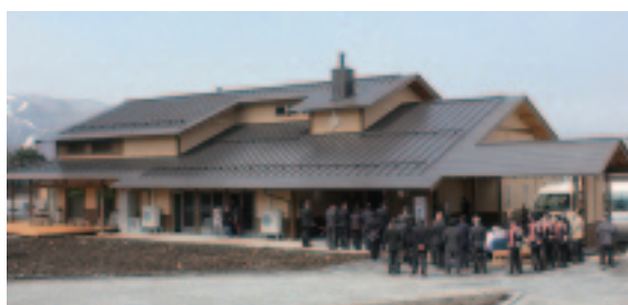
▲「一本松の家」として親しまれます

この施設を通じて、地域コミュニティや福祉・文化活動がより発展し、利用される方が心から安心して暮らし続けること、これが私たちの願いです。