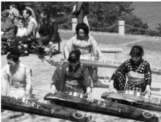
▲青空の下、展望広場で行われた琴の演奏

4月1日、黄金崎公園で「第30回黄金崎さくらまつり」が開催されました。地場産品の販売や、さくらまつりでは初の試みとなるジオガイドツアー、餅つき体験などのイベントが行われ、多くの来場者でにぎわいました。