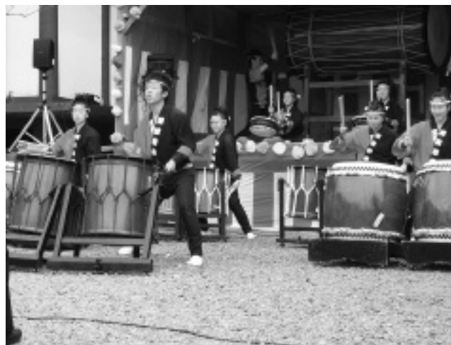
▲伊豆総合高校郷土芸能部員が、祭典を盛り上げました。

4月3日、県の有形文化財に指定されている薬師如来、阿弥陀如来、釈迦如来の三体を祭る堂ヶ島薬師堂で春の祭典が開催されました。白山神社での神事、薬師堂で読経を行い豊漁や地域住民の健康を祈願した後、特設ステージでは地元の老人クラブや子ども会による踊りやカラオケ、県立伊豆総合高校郷土芸能部の勇壮な和太鼓演奏が披露され、来場者からは拍手や歓声を送られました。