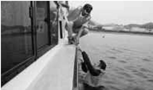
無いのが一番ですが