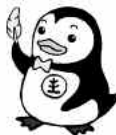
更生ペンギンの ホゴちゃん