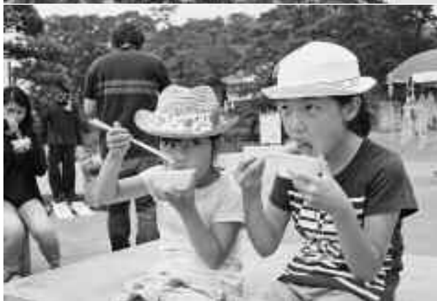
沢田地区の乗浜海岸には、たくさんの天草が天日干しされました／天草・ところてん祭りの様子