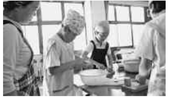
始めて包丁を持った子ども・・・

通学合宿は、子どもたちの協調性や自主性を養うことを目的に行われ、3日には、子どもたち自ら夕食のカレーに使う玉ねぎやニンジンなど野菜を刻みました。夕食後には、大田子の円城寺までグループに分かれ夜の探検をし、楽しみました。