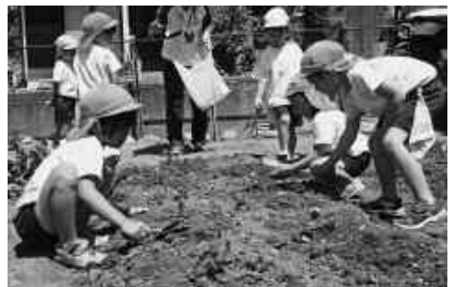
苗を1つ1つ丁寧に植えました

「1支店1協同活動」の一環として行っており、園児たちは町内の農家が提供した苗を、植え付け方法などを教えてもらいながら丁寧に植えつけ後、「大きくなーれ」と願いを込めました。落花生は10月上旬に収穫される予定です。