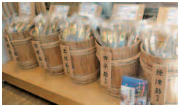
他の産地と一緒に田子節が陳列されています

5月27日～28日には、NAMIHEIのほか、町の食文化と深いつながりのある出汁を専門に取り扱っている日本橋「にんべん だし場」などを視察しました。この他、町がアンテナショップの出店を計画している秋葉原にある「日本百貨店しょくひんかん」、埼玉県新座市のボランティアガイドの様子などを研修しました。