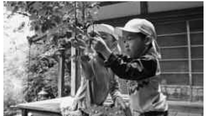
梅のい〜い香りがしました

境内に植えられた梅の木にたわわに実った梅を、園児たちは次から次へと手を伸ばしたり、大人に手伝ってもらったりしながら持参した2つの籠をいっぱいにしていました。収穫した梅は、園児自ら洗った後、梅ジュースや梅ゼリーを作ります。