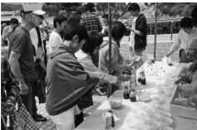
酢醤油、黒蜜、好みの味つけで・・・

観光客などはその場で突いた冷たいところてんを次々に食べていました。なかには、味つけを変え2杯目に手を伸ばす人もいました。ところてんは1日1000食が無料で配られ、天草を使ったところてんの作り方の実演なども行いました。