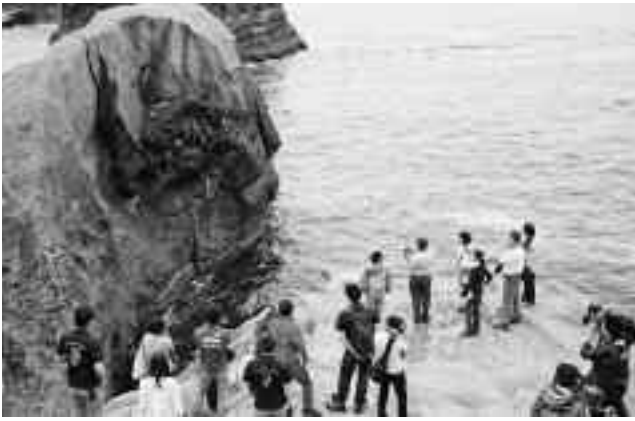
堂ヶ島では英語でガイド