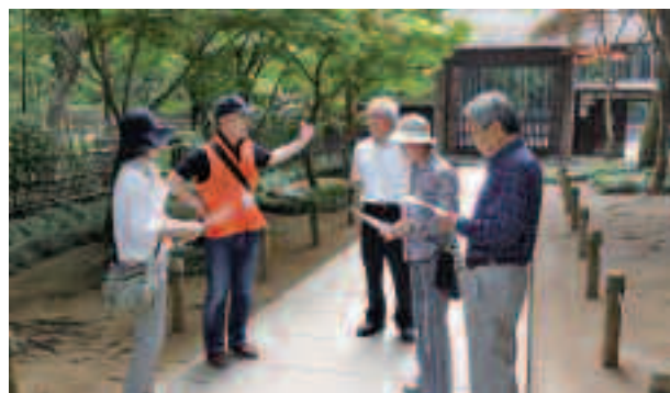
熱心にボランティアガイドの説明を聞く参加者