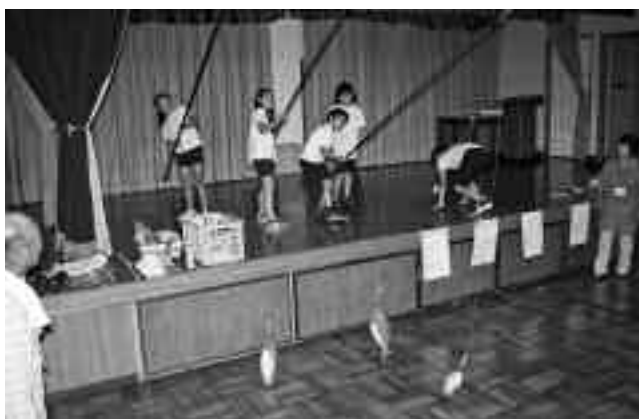
本物の竿を使ってカツオの一本釣り体験