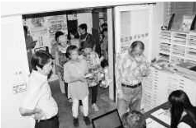
やっと順番が・・・