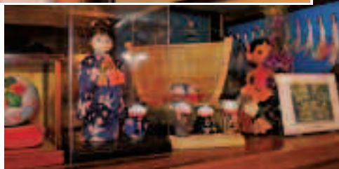
手芸は個展を開くほどの腕前