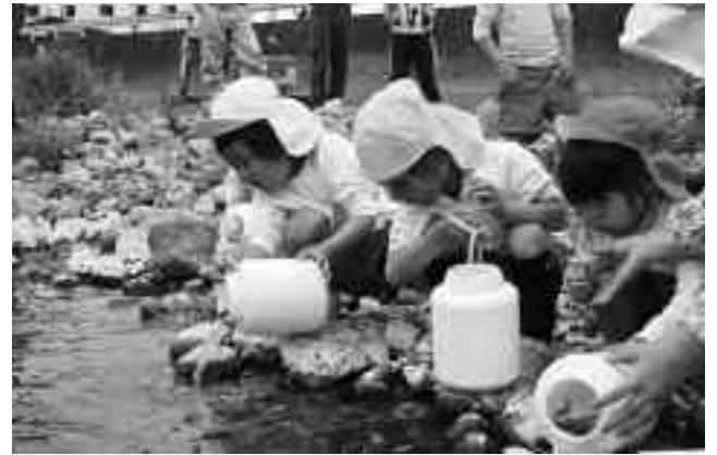
泳いで行くアユに大騒ぎ

園児たちは、築地橋付近で体長約10cmほどに成長した稚魚に、「大きくなってね」と声をかけながらアユを見送りました。今年の仁科川では、例年より小さいながらも、4月半ばころからアユの遡上が見られ始めたそうです。