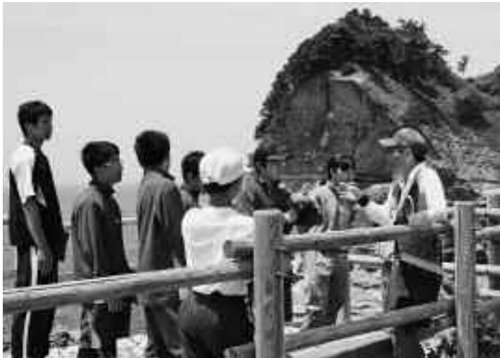
枯野公園でジオに触れました

黄金崎クリスタルパークでは、45名が参加しサンドブラストを体験。コップや小皿に絵などを描き、絵の具が乾いた後、コンプレッサーで自ら砂を吹き付け加工していました。生徒