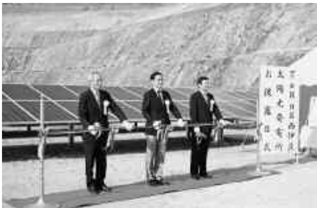
賀茂地区で最大規模のメガソーラー