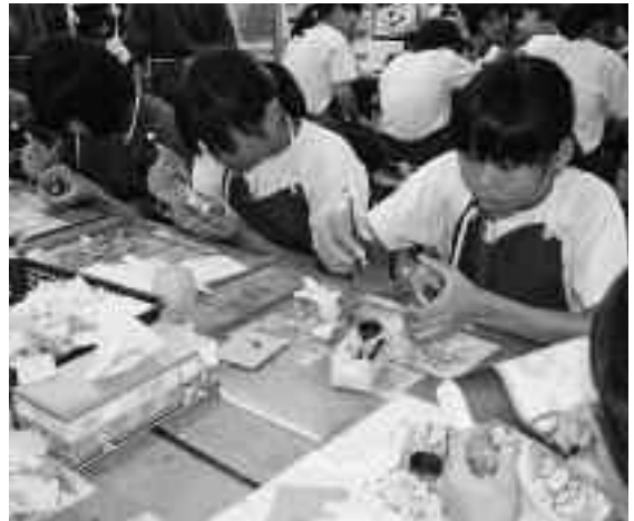
思い思いの絵や文字を描きました

また、「ジオって何だ」では町内のジオポイントを巡りながら、「枕状溶岩」や「断層」などのほか、伊豆半島で過去に起こった3度の大地震についても触れ、ジオパークと地震や津波との関係などについて学習しました。