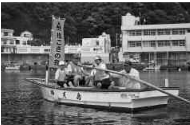
来年は、もっと上手になるかな！