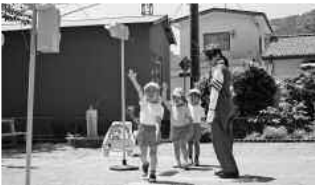
「右よし！左よし！前よし！」