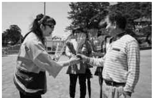
またお越しください

女将の会は、ゴールデンウィーク中の5月1日、地元で栽培されたマーガレット約200束を配布しています。遊覧船乗り場や駐車場付近で観光客一人ひとりに声を掛けながら配布し、感謝と西伊豆のPRを行いました。女将の会では、10年ほど前から毎年行っています。