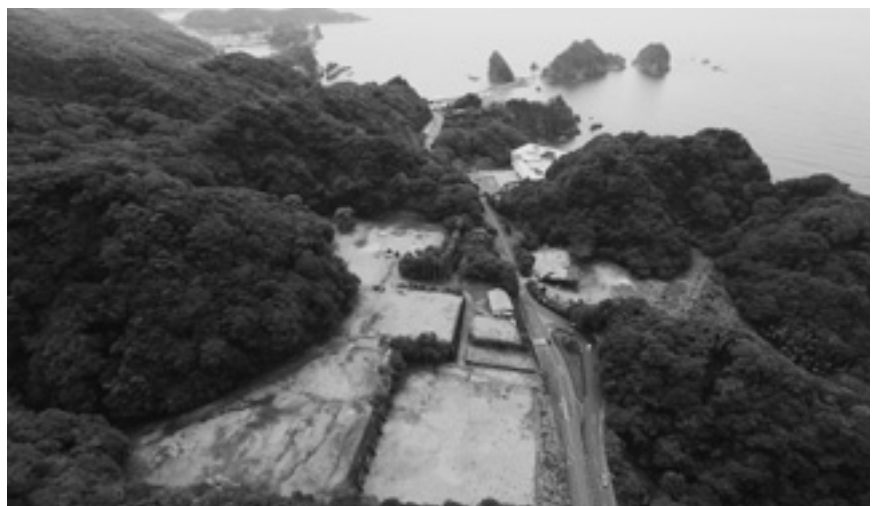
利用次第で宝の山に