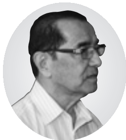
山本 榮 議員