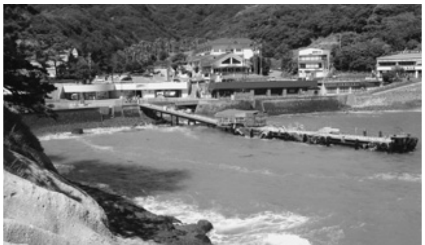
堂ヶ島のイメージアップを