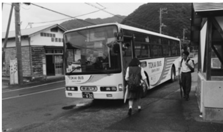
期待される地元の高校生