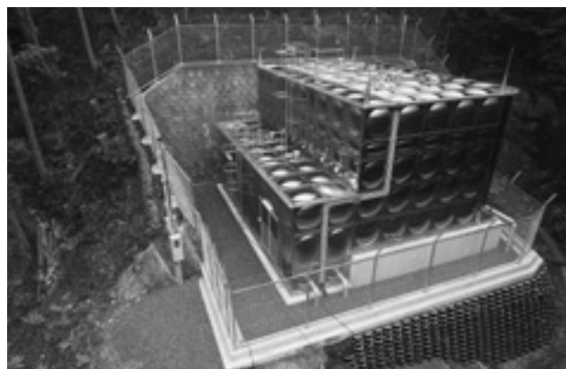
宇久須配水池耐震化工事