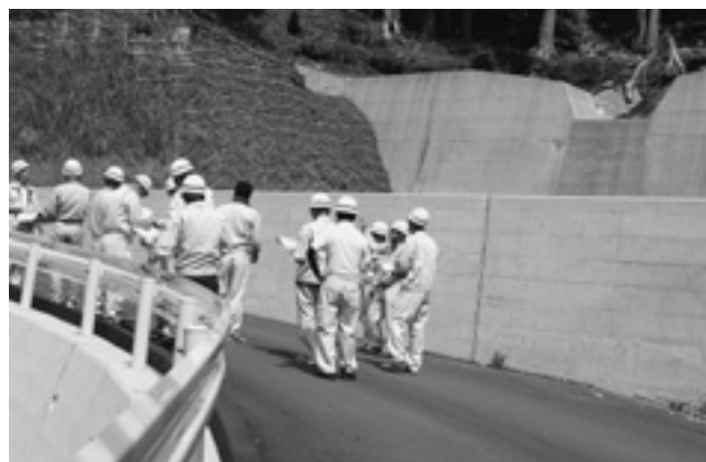
林道祢宜畑倉見線災害復旧工事