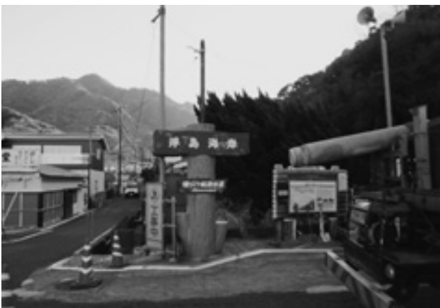
改修前の浮島海岸