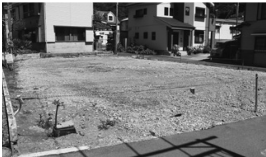
避難タワー建設が待たれます

町長 ホテル跡地を開放していただき活用できないかなど、商工会・観光協会・町で協議していきます。