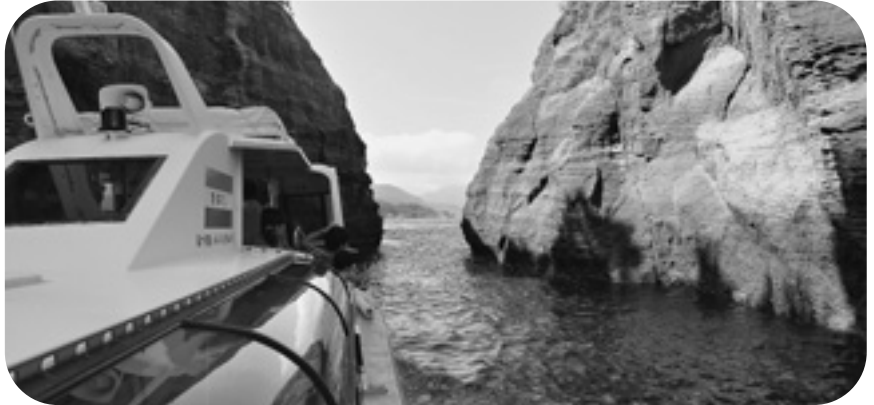
ジオガイドが乗船するジオサイトめぐり