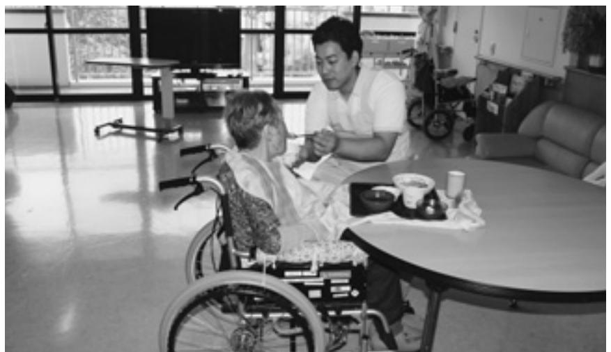
介護人材確保対策事業やらなくて大丈夫か