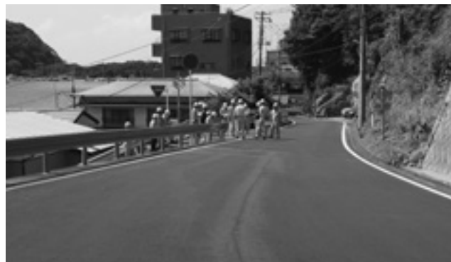
町道浦上八木線改修工事

26年度の路面性状調査の結果により、舗装の打換えを実施し、良好な生活環境と安全性確保、道路の長寿命化を図りました。