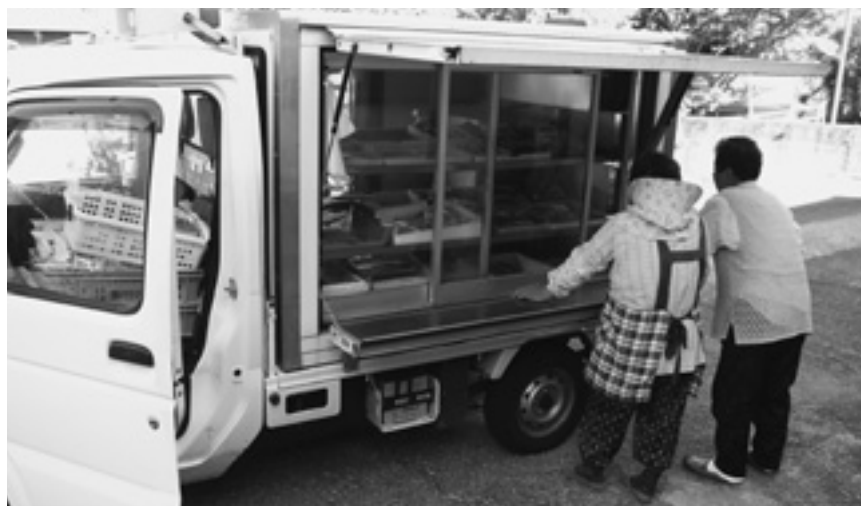
買い物弱者を支援する移動販売車

町長 観光PRの場合は保護する必要もありますが、利用して良い悪いという管理はすべきではないと思います。