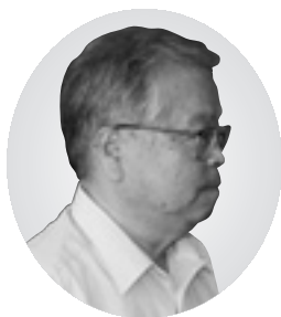
増山 勇 議員