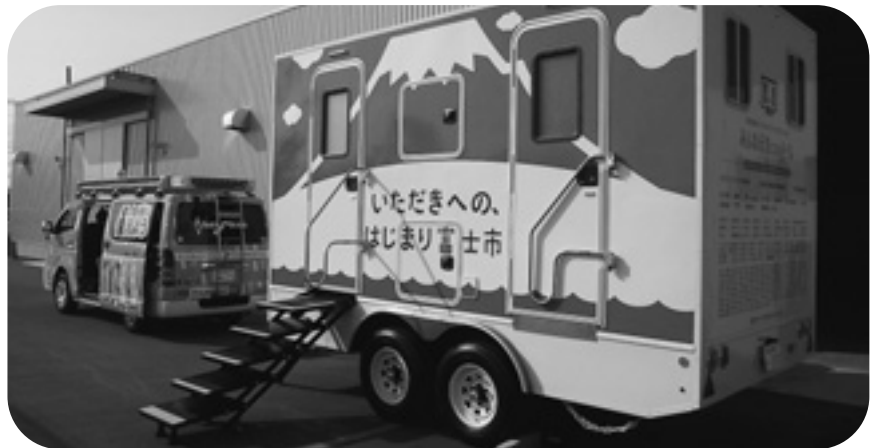
富士市が導入したラッピングトイレトレーラー