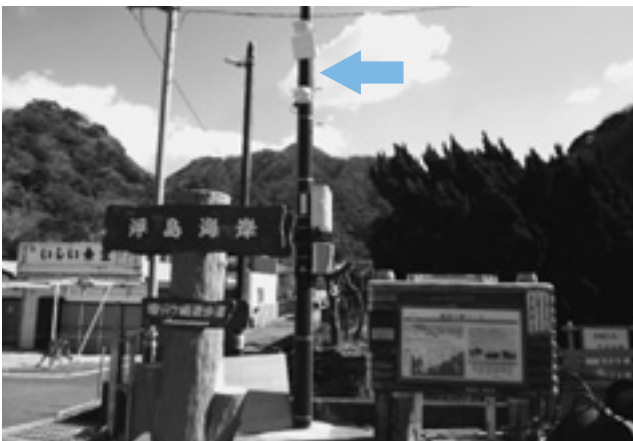
Wi-Fi整備後の浮島海岸