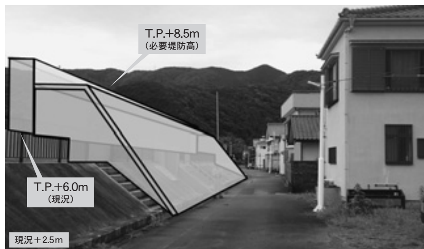
防潮堤かさ上げの例(宇久須地区)