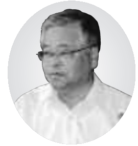
増山 勇 議員