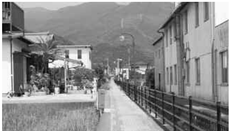
LED街路灯に改修予定の宇久須通学路