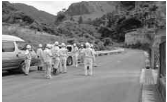
町道1号線災害復旧工事

浮島温泉の不具合（湧出量の減少・源泉温度の低下・度重なる改修工事等）により、浮島温泉の存続について加入者と相談の結果、堂ヶ島温泉に切り替えることになりました。堂ヶ島温泉配湯管を、堂ヶ島ニュー銀水付近から浮島温泉タンクまで、全長623m延長しました。