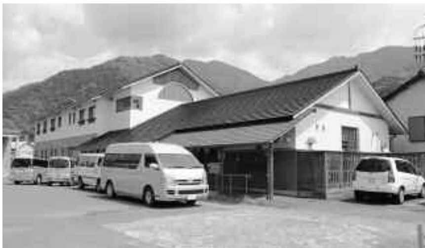
賀茂健康センター