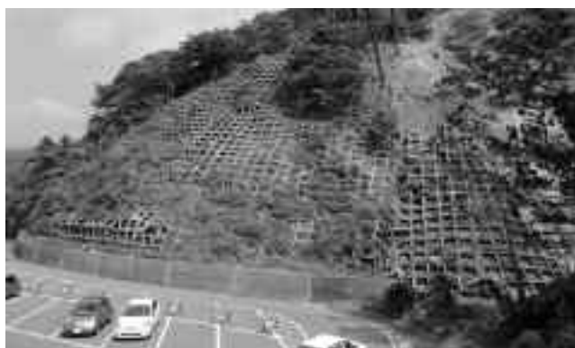
改修前の黄金崎駐車場法面