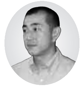
星野 淨 晋 議員

質問 以前から学校施設の統合に関する質問をしているが、生徒数の減少により、賀茂中はバレーボール部が無くなった。数年後にはテニス部も無くなるのではと危惧している。また、クラス替えのできない状況でもあり、少しでも多くの選択肢があったほうがよいと感じる。どのような環境で教育することが『子供にとって良いのか』という視点で考えていただきたいが。