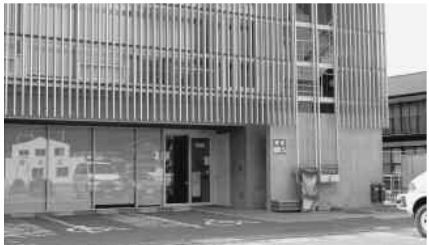
津波避難ビルの指定

町長 二種類の表示により勘違いされることがあると思われるので、津波浸水深は表示しません。