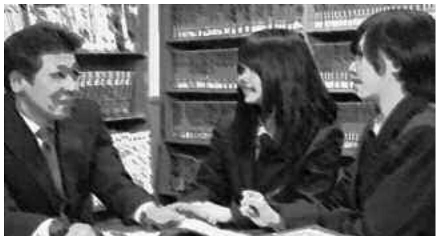
希望の手助けする制度を

町長 フリーペーパーを利用した情報発信は、東京にアンテナショップを開設した時点で始める計画で、準備をしています。