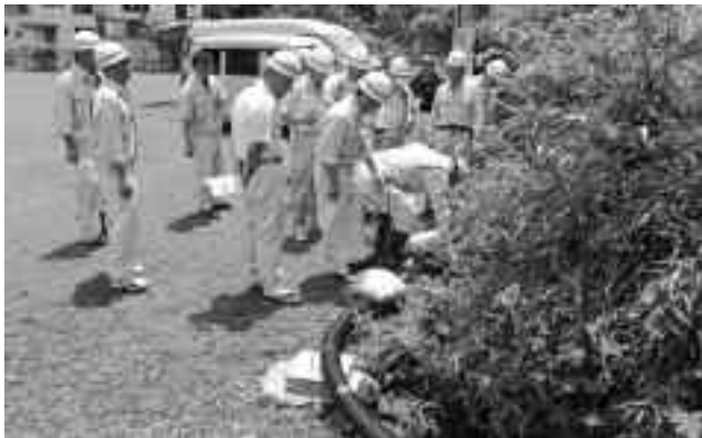
堂ヶ島温泉配湯管延長工事