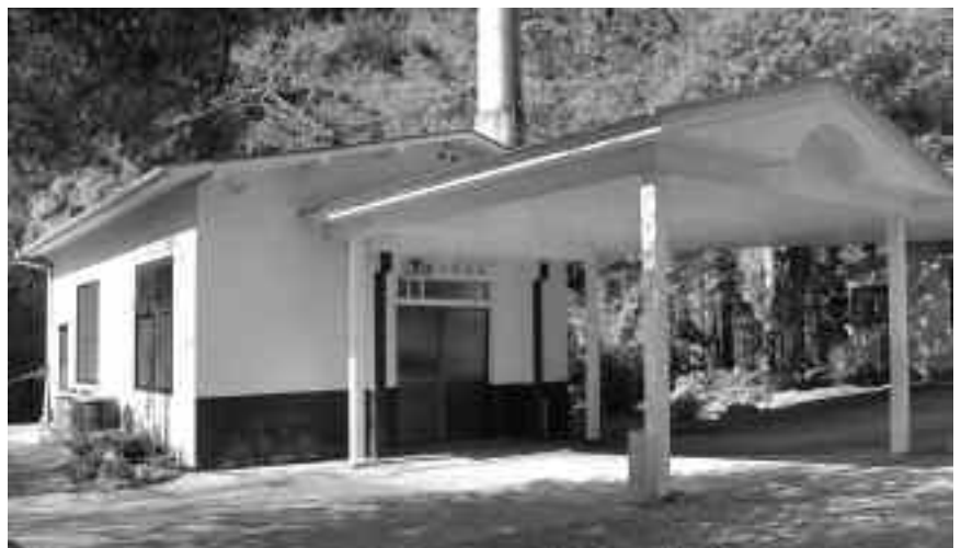
いつまで使うのか？