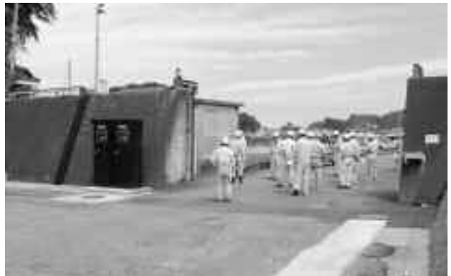
津波防災ステーション工事

仁科地区の水門及び陸閘について、緊急時の自動閉鎖と遠隔操作化を実施しています。平成25年度繰越、平成26年度工事と合わせて、沢田水門・大浜水門・陸閘3基の遠隔操作化、光ケーブルの敷設、陸閘監視カメラポールの設置などを行い、防護ラインの完成を目指しています。