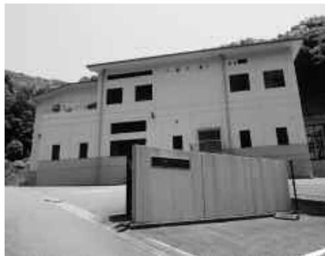
し尿・浄化槽汚泥高度処理施設

6月19日に西伊豆町と松崎町が、し尿・浄化槽汚泥高度処理事業をする、西豆衛生プラント組合の第1回臨時会が開かれました。過日行われた指名競争入札で、3年間の運転管理業務委託を、総額1億630万4,400円で榊協メンテナンスが落札し、従来よりも5,212万円安い金額となりました。それにより、本年度分が1,737万4千円の減額補正となりました。西伊豆町負担分は、3年間で3,127万円軽減される見込みです。