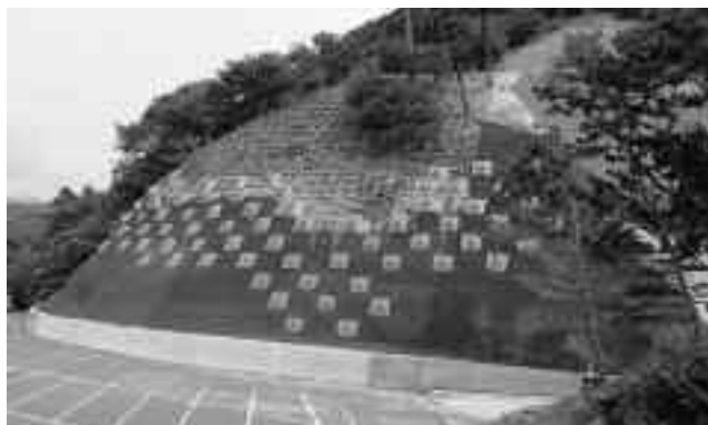
改修後の黄金崎駐車場法面