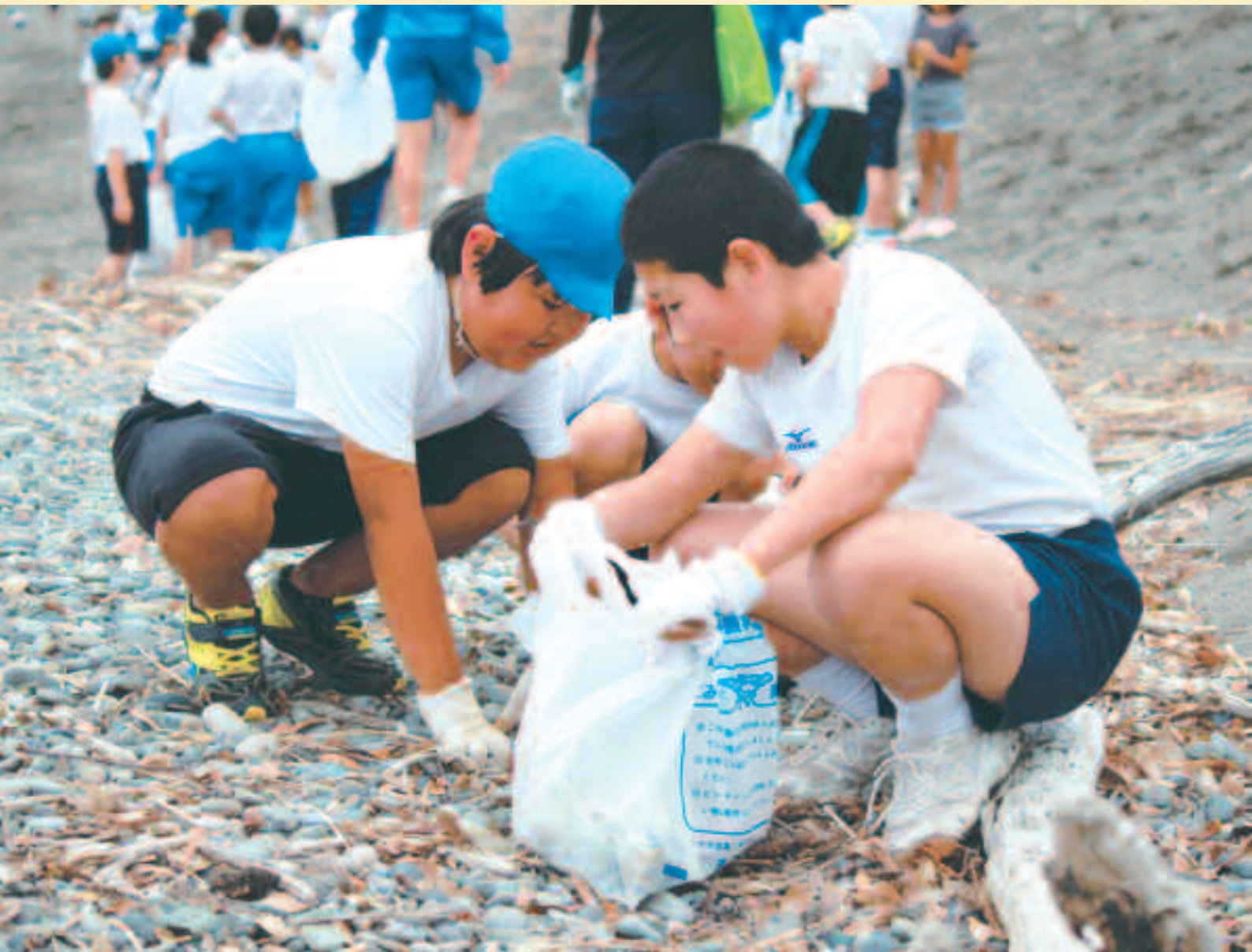
仁科小学校・西伊豆中学校合同海岸清掃（大浜海岸）